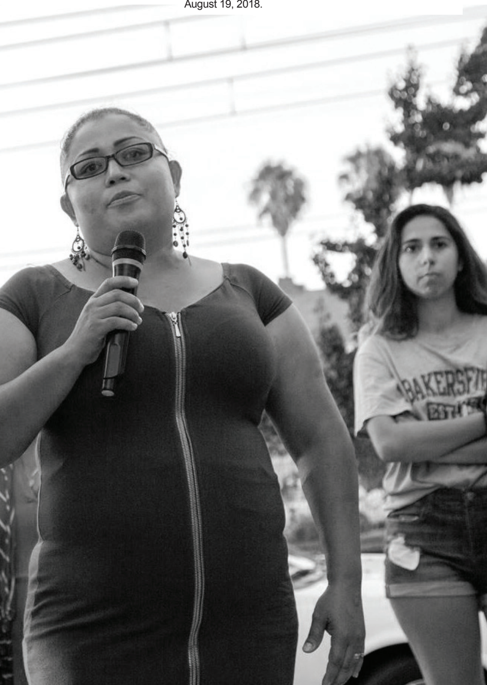
Photo: Exposition tenants farewell party, South Central, August 19, 2018.