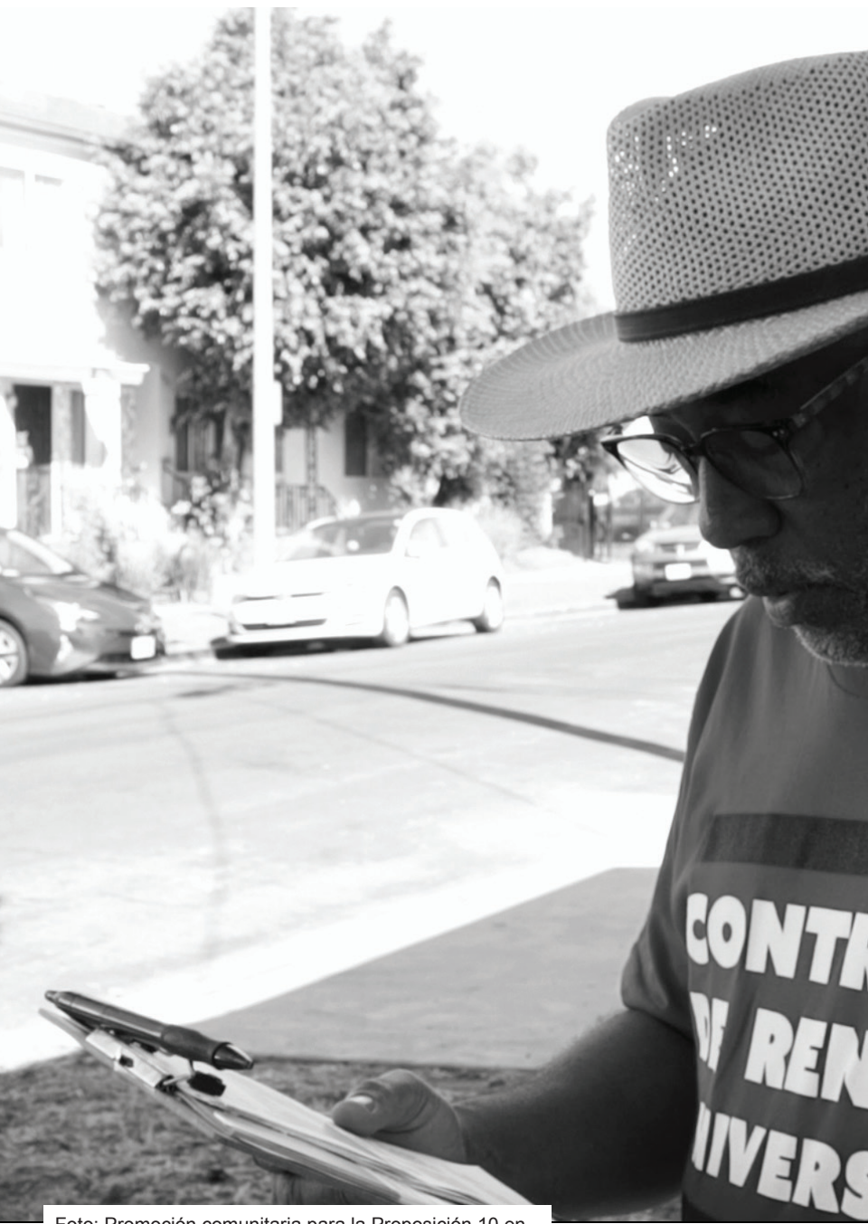
Foto: Promoción comunitaria para la Proposición 10 en mid-city.