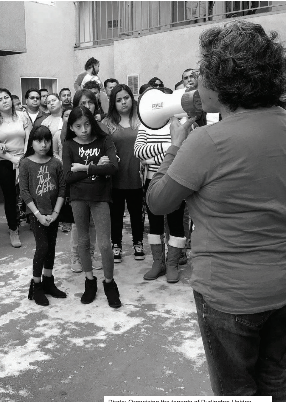
Photo: Organizing the tenants of Burlington Unidos, Westlake, February 11, 2018.