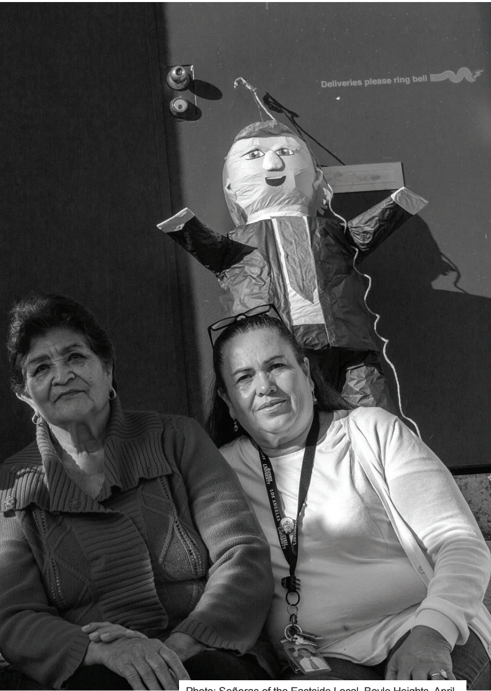
Photo: Señoras of the Eastside Local, Boyle Heights, April 28, 2018.