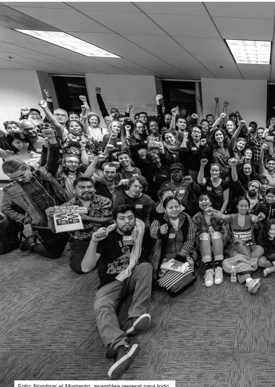
Foto: Nombrar el Momento, asamblea general para todo el sindicato, UTLA, 3 de diciembre 2018.