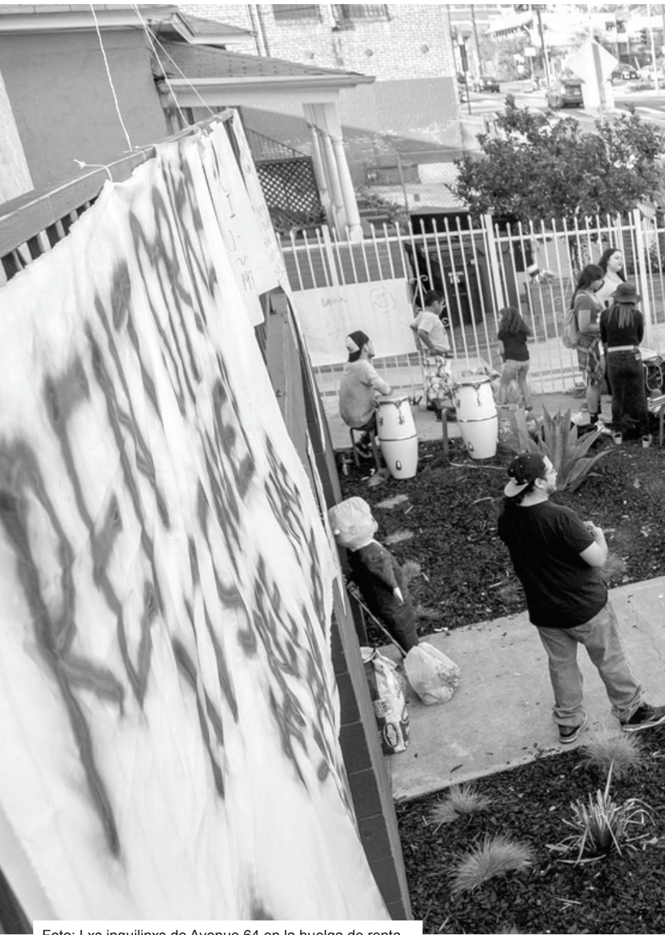
Foto: Lxs inquilinxs de Avenue 64 en la huelga de renta, Highland Park, 25 de agosto 2018.