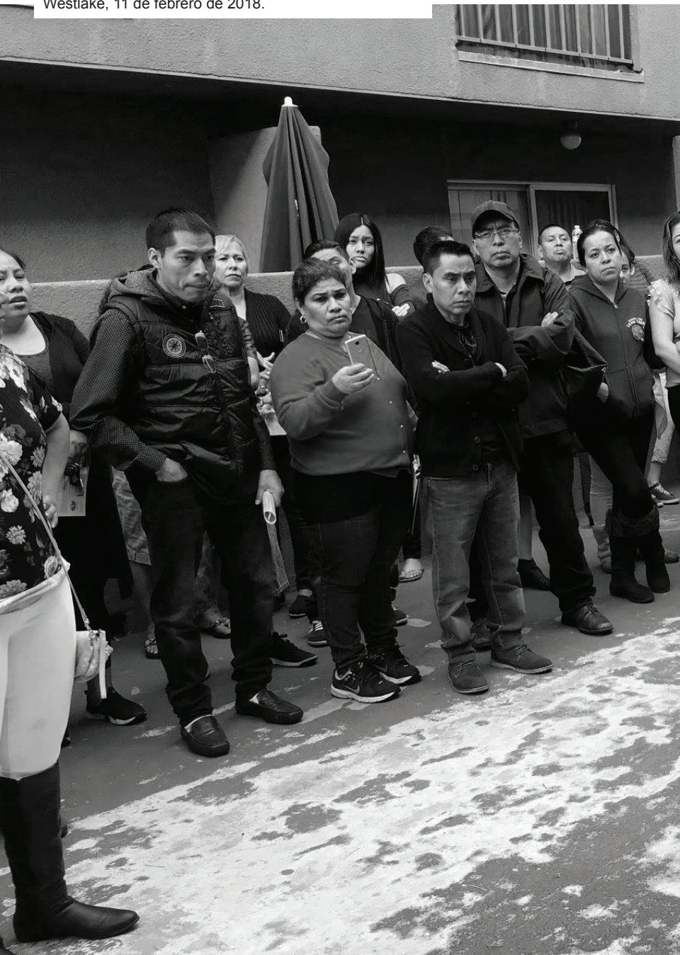
Foto: Organizando a lxs inquilinxs de Burlington Unidos, Westlake, 11 de febrero de 2018.