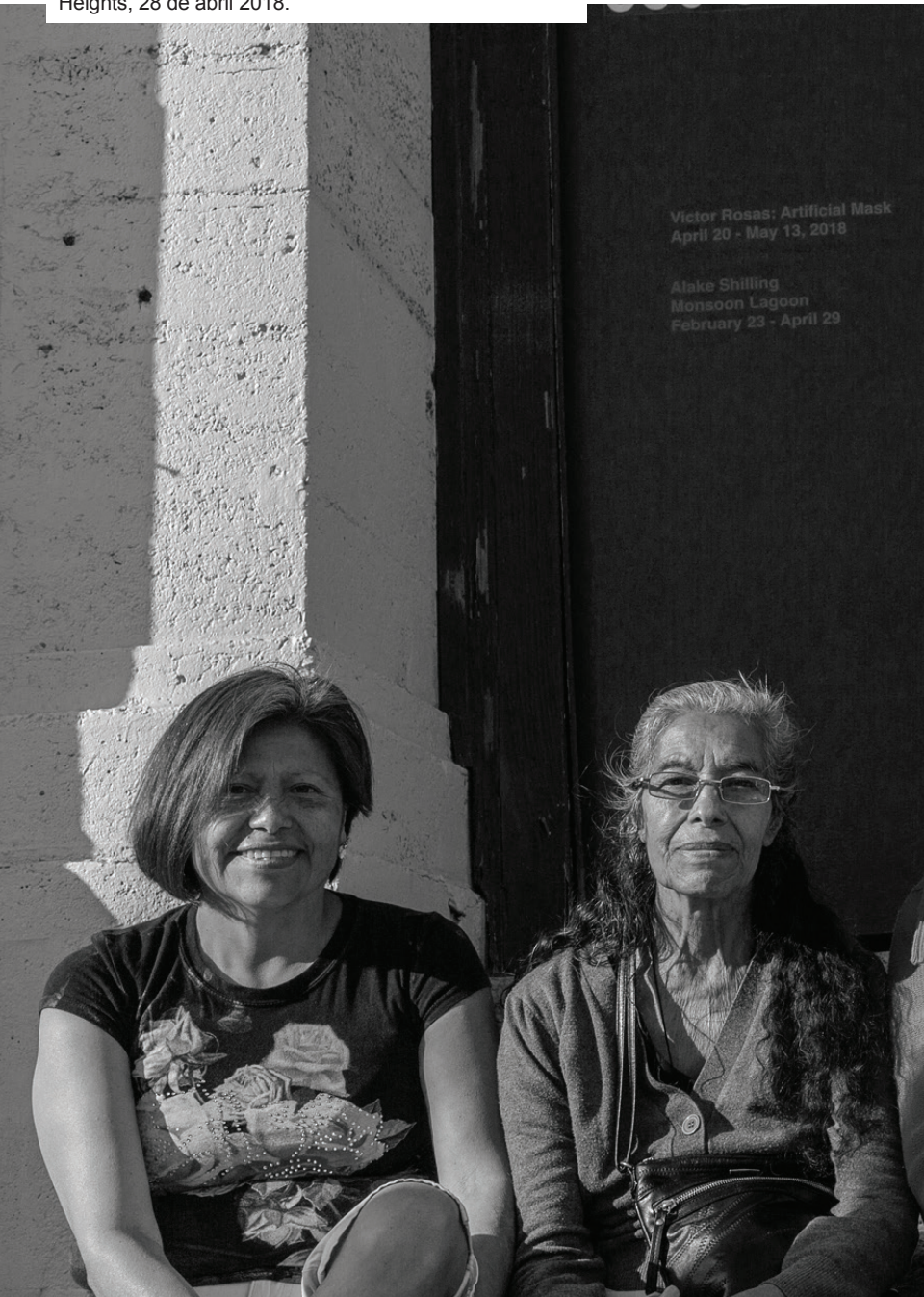
Foto: Las señoras de la Sección Local del Este, Boyle Heights, 28 de abril 2018.