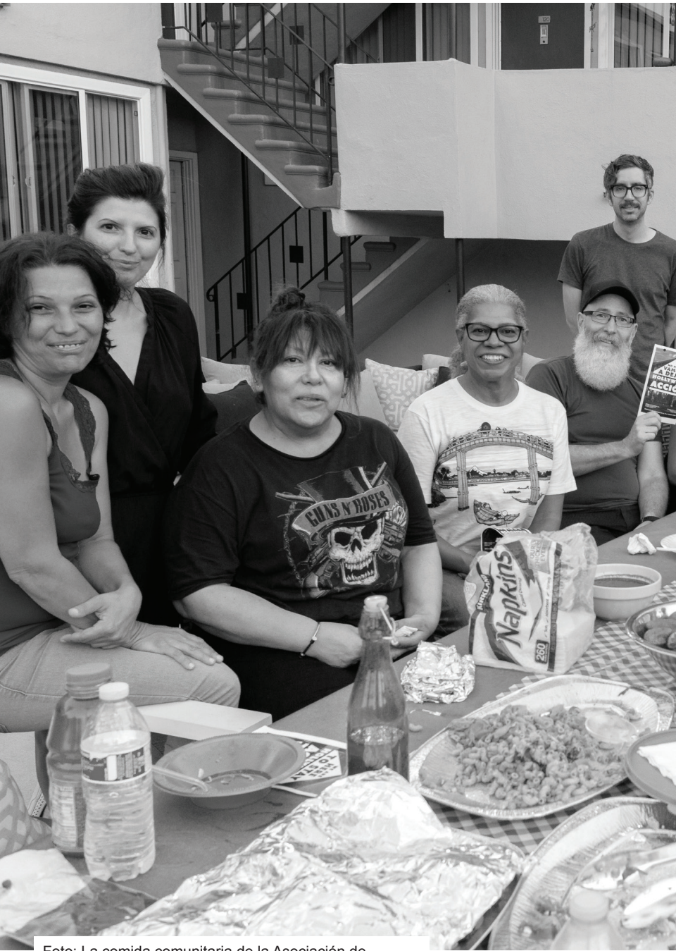
Foto: La comida comunitaria de la Asociación de Inquilinxs de DeLongpre, Hollywood, 4 de agosto 2018.