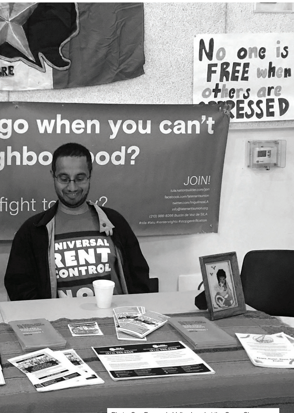
Photo: San Fernando Valley Local at the Cesar Chavez Inspirational Youth Conference, Pacoima, March 10, 2018.