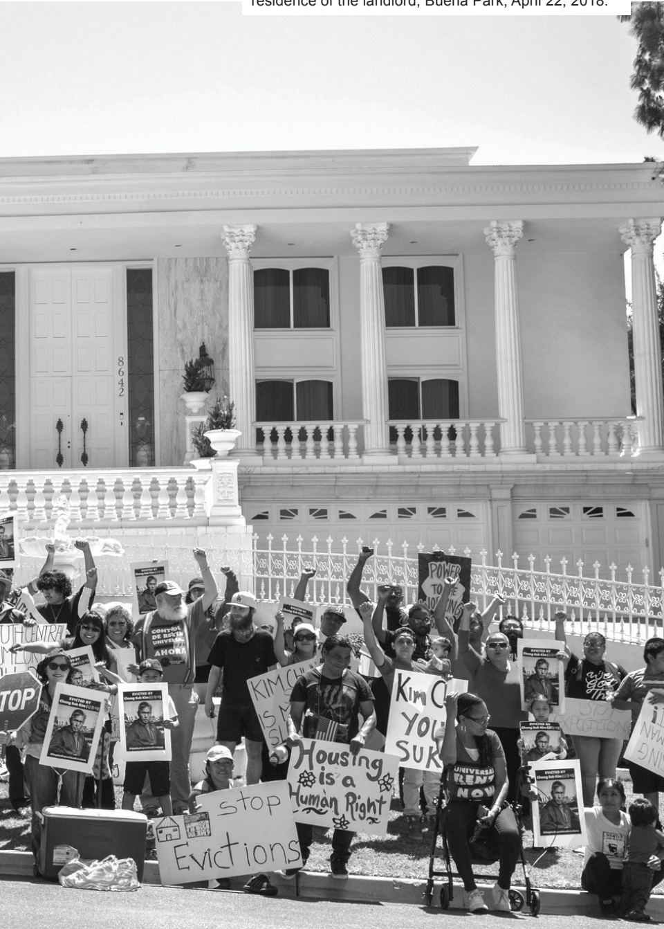
Photo: Exposition tenants rent strike protest at the residence of the landlord, Buena Park, April 22, 2018.