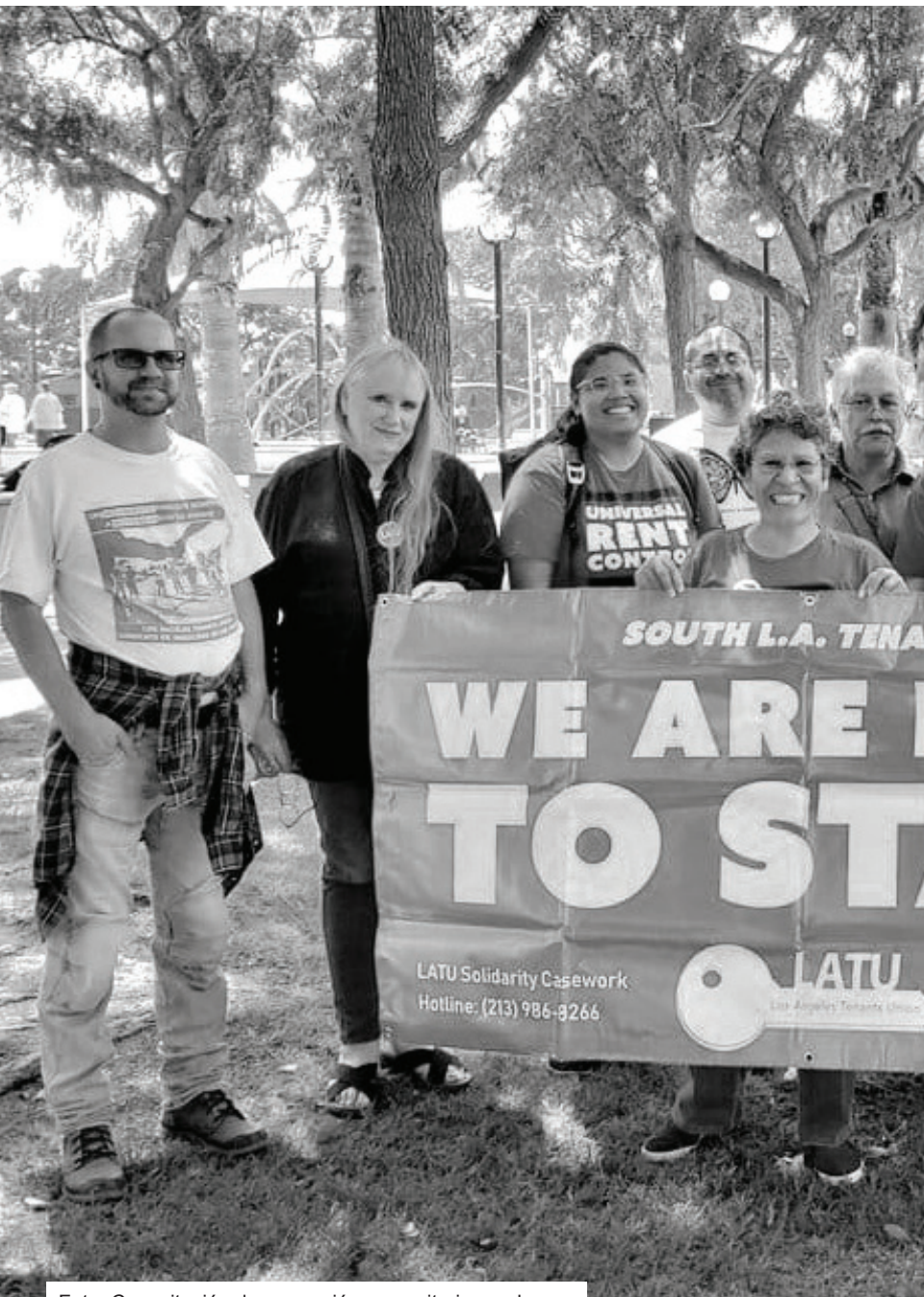
Foto: Capacitación de promoción comunitaria en el Parque Jesse Brewer Jr., 25 de agosto 2018.