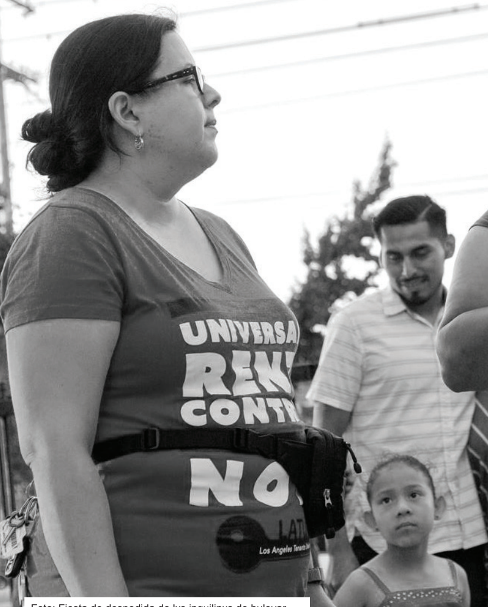
Foto: Fiesta de despedida de lxs inquilinxs de bulevar Exposición, Sur de Los Ángeles, 19 de agosto 2018.