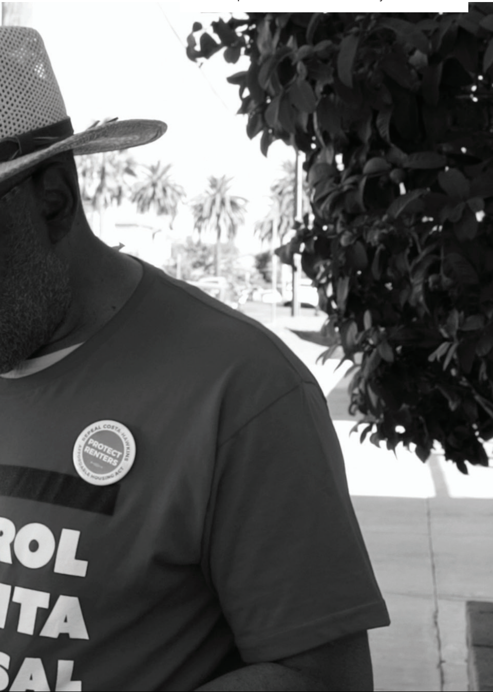
Photo: Proposition 10 outreach in mid-city.