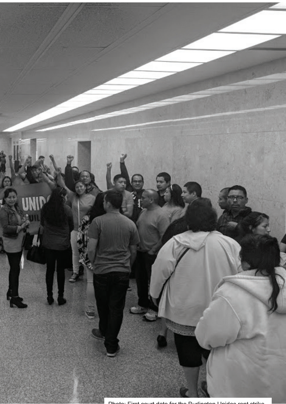
Photo: First court date for the Burlington Unidos rent strike, April 25, 2018.