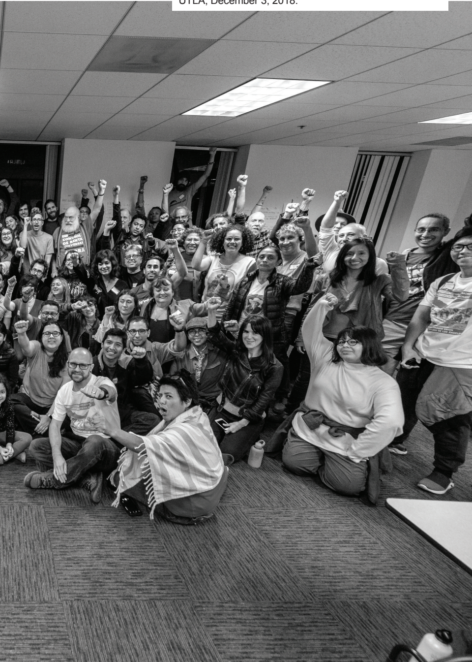
Photo: Naming the Moment, unionwide general assembly, UTLA, December 3, 2018.