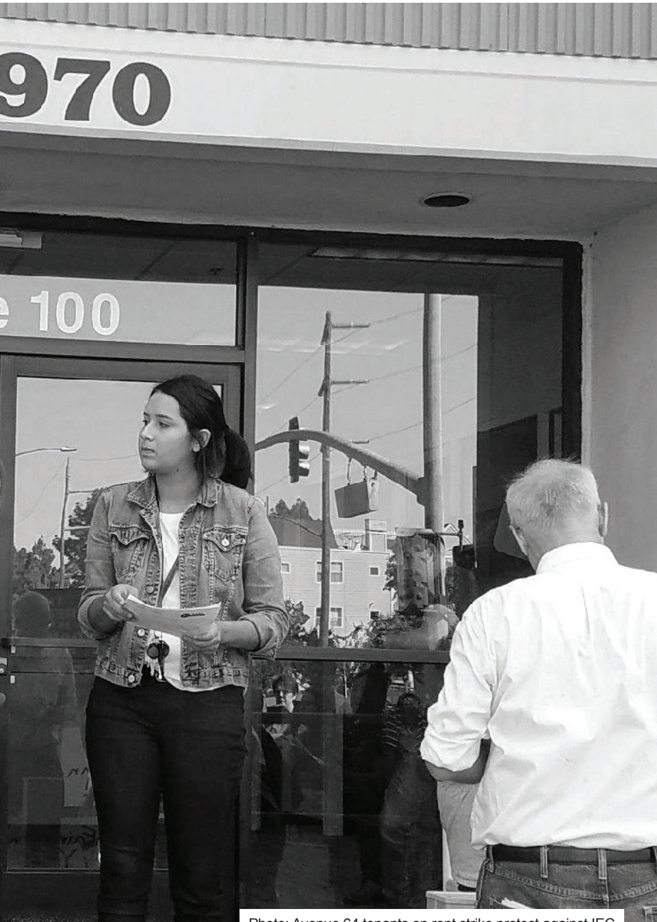
Photo: Avenue 64 tenants on rent strike protest against IEC Properties, Palo Alto, August 10, 2018.