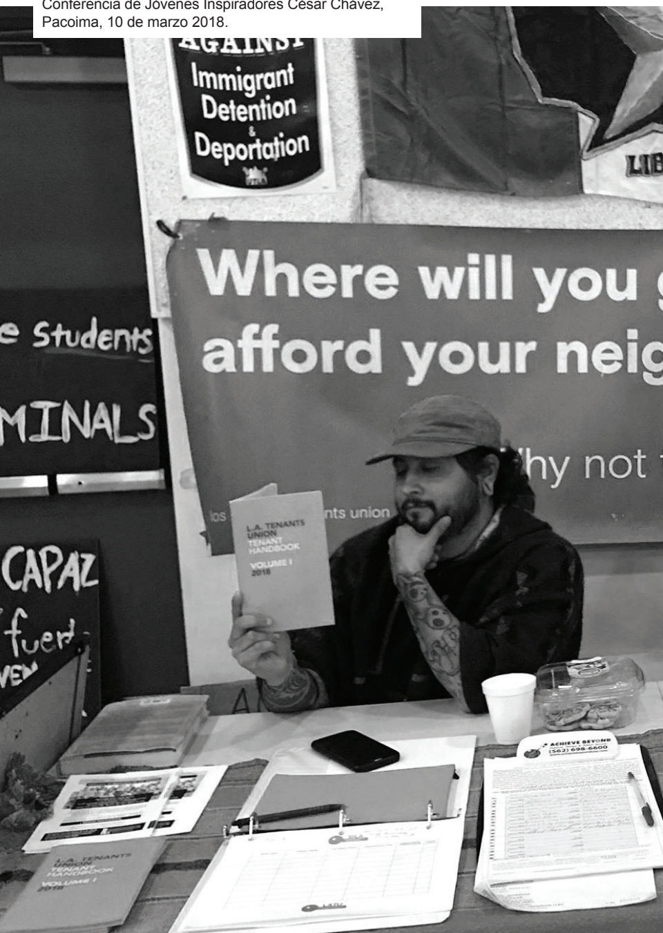
Foto: Sección del Valle de San Fernando en la Conferencia de Jóvenes Inspiradores César Chávez, Pacoima, 10 de marzo 2018.