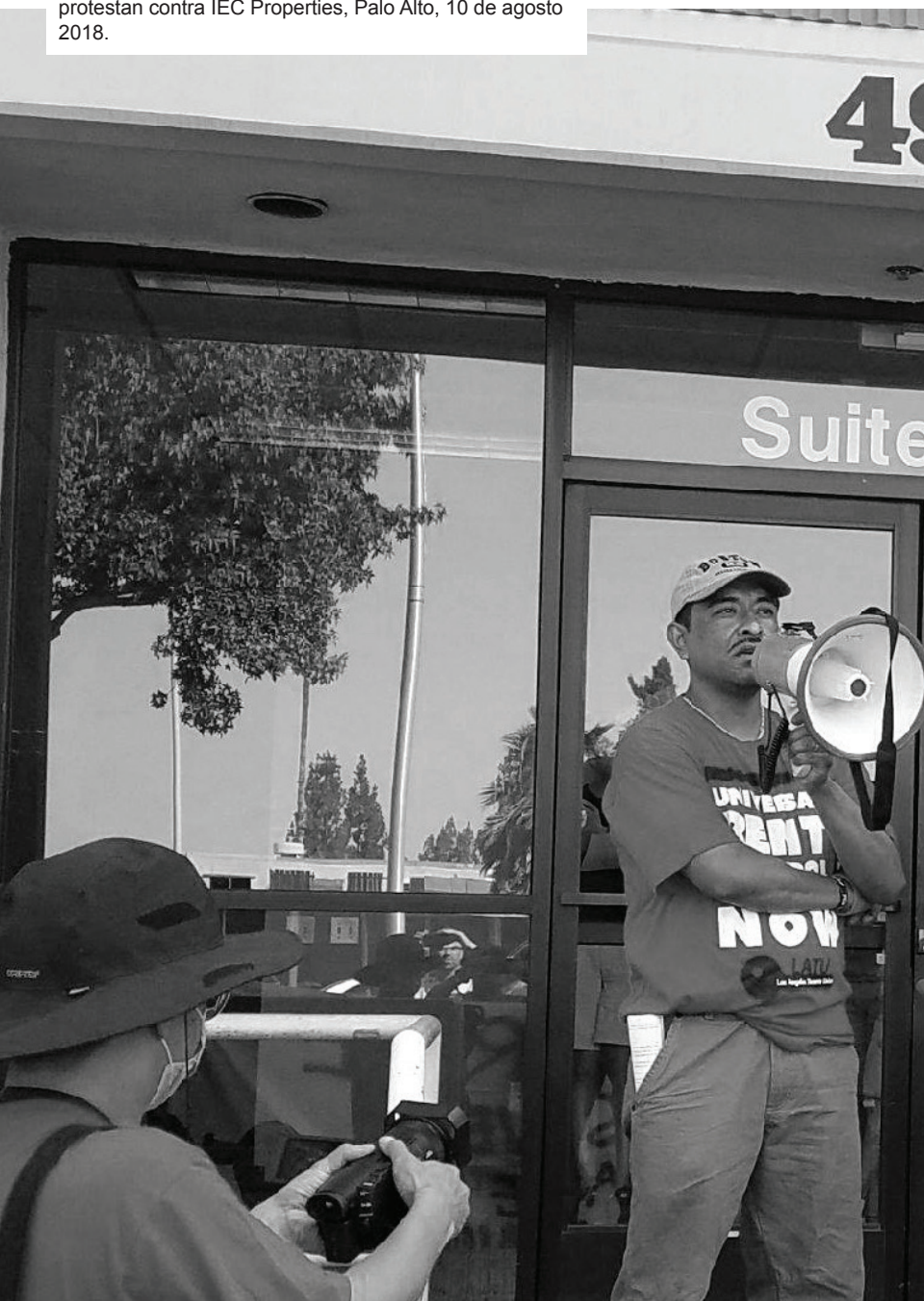
Foto: Lxs inquilinx de Avenue 64 en la huelga de renta protestan contra IEC Properties, Palo Alto, 10 de agosto 2018.