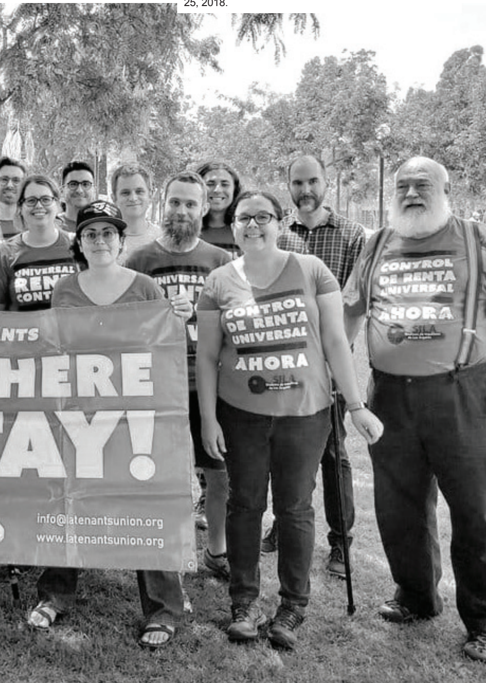
Photo: Outreach training, Jesse Brewer Jr. Park, August 25, 2018.