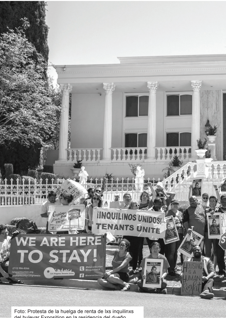
Foto: Protesta de la huelga de renta de lxs inquilinos del bulevar Exposition en la residencia del dueño, Buena Park, 22 de abril 2018.