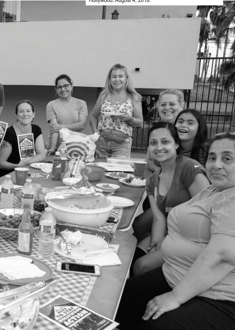
Photo: The DeLongpre Tenants Association potluck, Hollywood, August 4, 2018.