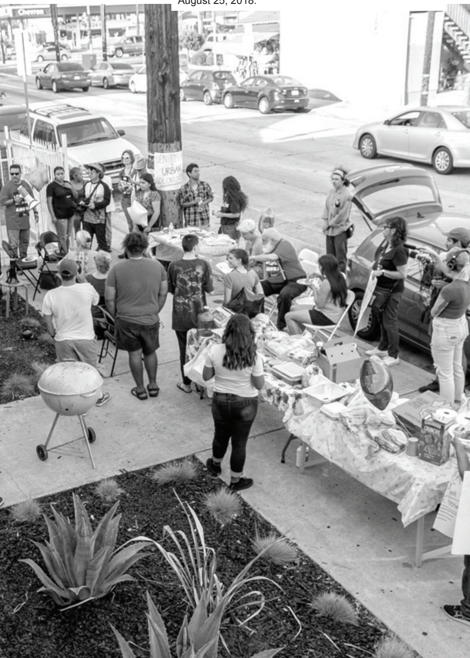
Photo: Avenue 64 tenants on rent strike, Highland Park, August 25, 2018.