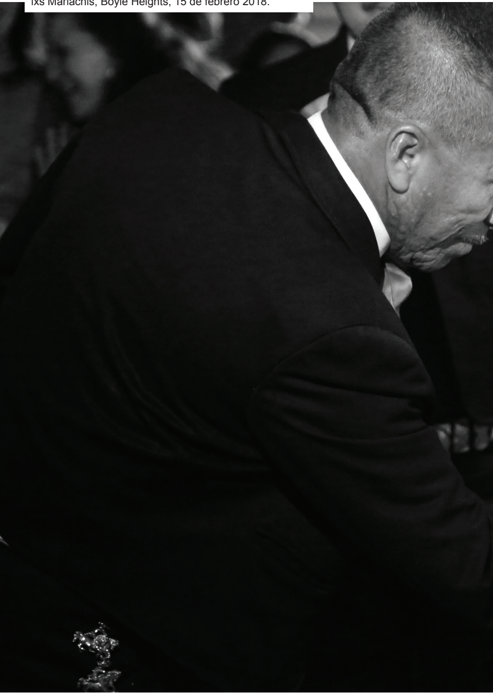
Foto: Celebración de la victoria de la huelga de renta de lxs Mariachis, Boyle Heights, 15 de febrero 2018.