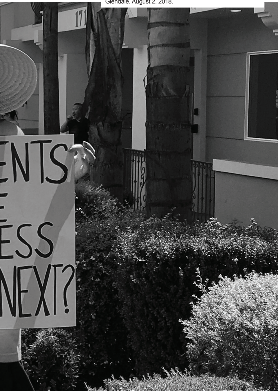
Photo: Protest in solidarity with the Avenue 64 rent strike, Glendale, August 2, 2018.